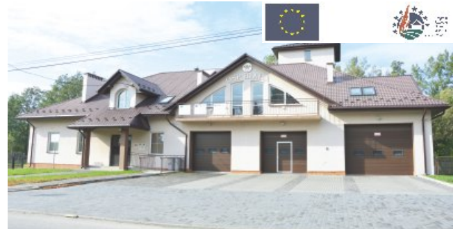
„Stworzenie Centrum Kulturalno-Rekreacyjnego we wsi Biała II”