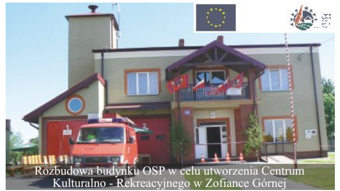
Rozbudowa budynku OSP w celu utworzenia Centrum Kulturalno - Rekreatywnego w Zofiance Górnej