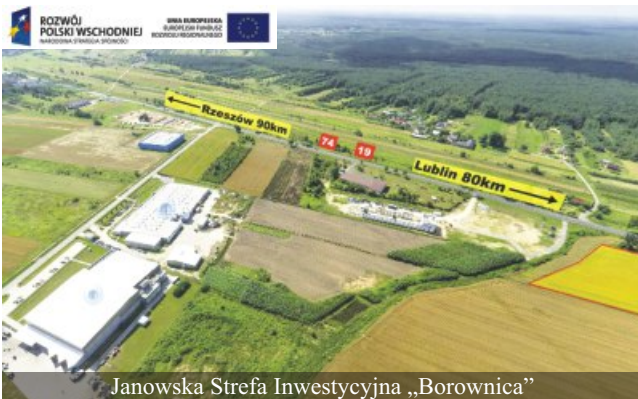
Janowska Strefa Inwestycyjna „Borownica”