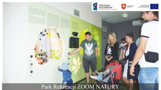
Park Rekreacji ZOOM NATURY

Wśród ważniejszych inwestycji zrealizowanych w 2004 - 2014 roku, należy wymienić: rewitalizację historycznego centrum Janowa Lubelskiego pod kątem wprowadzenia nowych funkcji kulturalnych wraz z rewitalizacją przestrzeni i budynków osiedla wielorodzinnego, oraz rewitalizację Parku Miejskiego, modernizację Urzędu Miejskiego wraz z otoczeniem, termomodernizację przedszkoli i bloków spółdzielczych, budowę krytej pływalni, modernizację układu transportowego Janowa Lubelskiego, modernizację i rozbudowę Janowskiego Ośrodka Kultury, kontynuację kompleksowej gospodarki wodno - ściekowej w Janowie Lubelskim