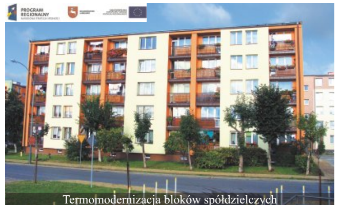
Termomodernizacja bloków spółdzielczych