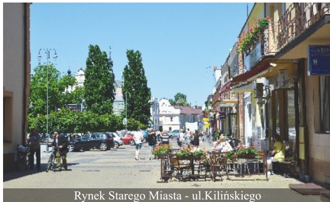
Rynek Starego Miasta - ul. Kilińskiego