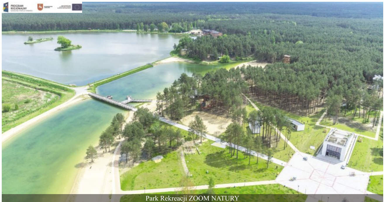
Park Rekreacji ZOOM NATURY