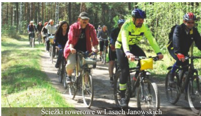
Ścieżki rowerowe w Lasach Janowskich