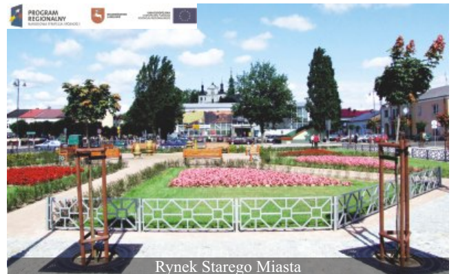
Rynek Starego Miasta