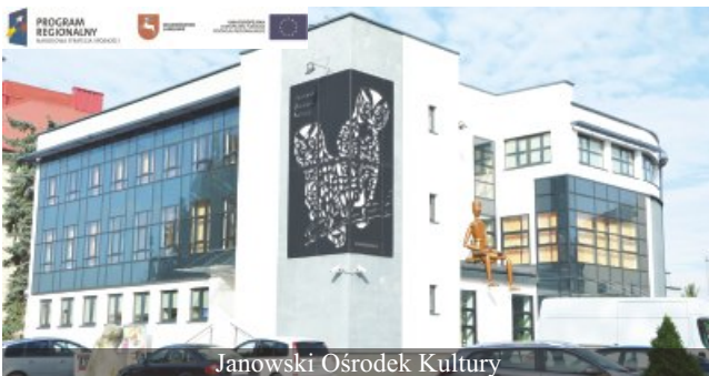
Janowski Ośrodek Kultury

Należy podkreślić, że Janów Lubelski już po raz kolejny znalazł się na pierwszym miejscu w Rankingu wykorzystania środków unijnych, tj. za lata 2004-2009, 2007-2011 oraz 2009-2012. Wysoka pozycja Janowa Lubelskiego wśród polskich miast powiatowych prestiżowym rankingu czasopisma „Wspólnota”, to potwierdzenie priorytetów naszego samorządu, który od lat, nastawiony jest na pozyskiwanie środków zewnętrznych.