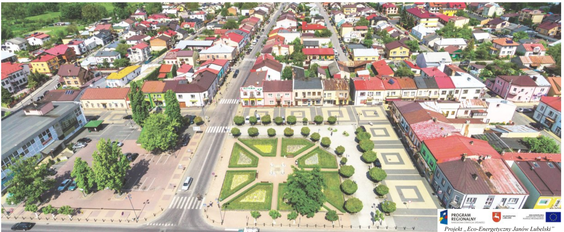
PROGRAM REGIONALNY NARODOWA STRATEGIA WZROSTU Projekt „Eco-Energetyczny Janów Lubelski”