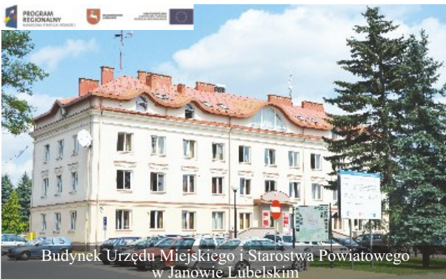
Budynek Urzędu Miejskiego i Starostwa Powiatowego w Janowie Lubelskim