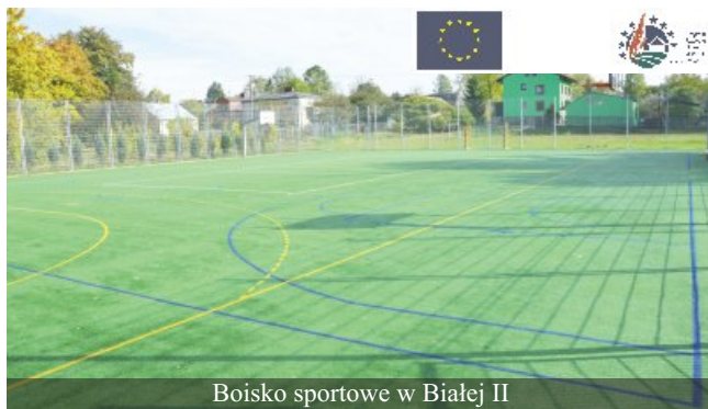
Boisko sportowe w Białej II