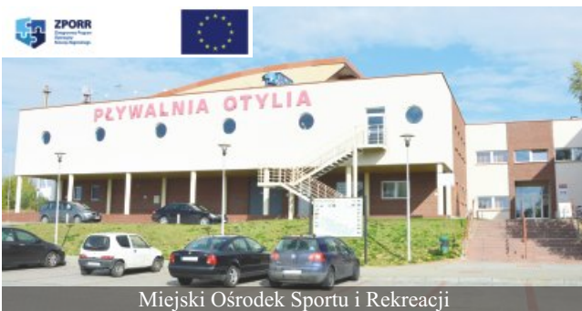
Miejski Ośrodek Sportu i Rekreacji