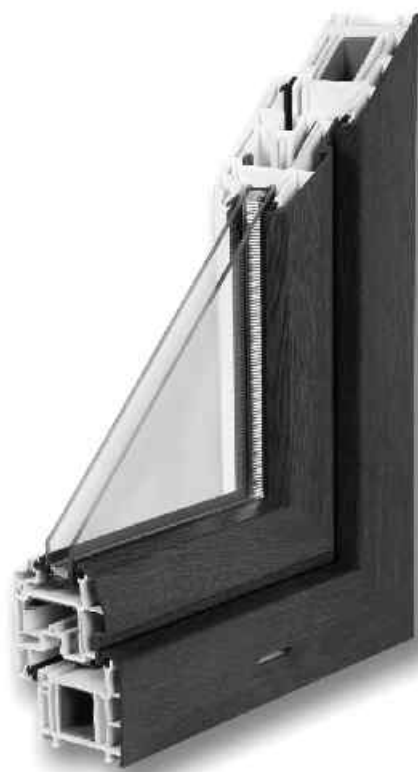
Przekrój okna AWANS - bialo-orzech

wymogi formalne i techniczne Związku „Polskie Okna i Drzwi”, gdzie skontrolowanych zostało dwudziestu producentów okien. Badania te pokazały jak fatalna jest jakość okien na