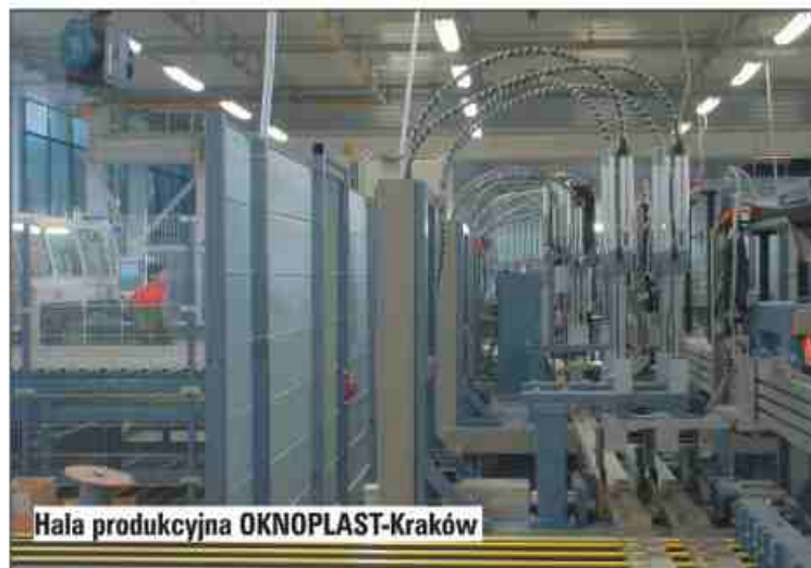
Hala produkcyjna OKNOPLAST-Kraków

AR: Wiem, że teraz Panią zaskoczę, ale dobór najwyższej jakości elementów to tylko jeden z warunków koniecznych do tego, by wyprodukować dobre okno. Wiele osób, oceniając jakość okien, kieruje się pewnym utrwalonym i niestety nieprawdziwym stereotypem. Wychodzą z założenia, że jeżeli okna są wykonane z takich samych profili oraz są wyposażone w podobne okucia i szyby termoizolacyjne, to oznacza, że ich jakość jest taka sama. To jednak tylko połowiczna prawda. Oczywiście elementy składowe okna mają bardzo istotny wpływ na jakość finalnego wyro-