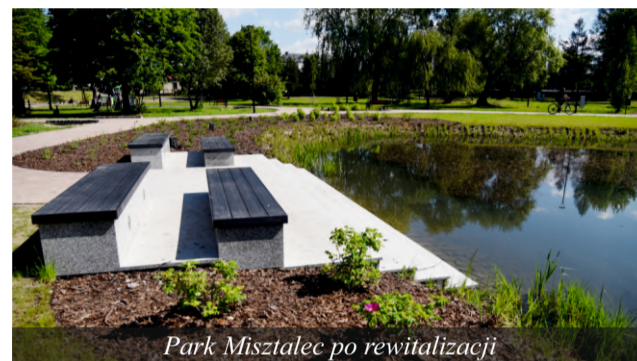
Park Misztalec po rewitalizacji