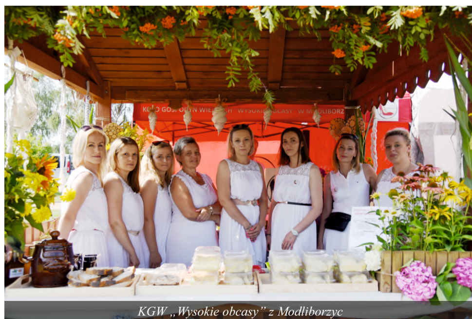
KGW „Wysokie obcasy” z Modliborzyc