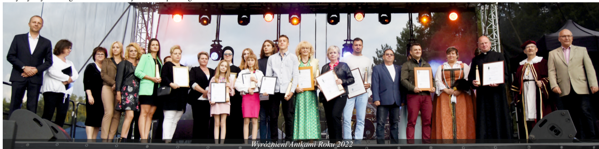
Wyróżnieni Antkami Roku 2022