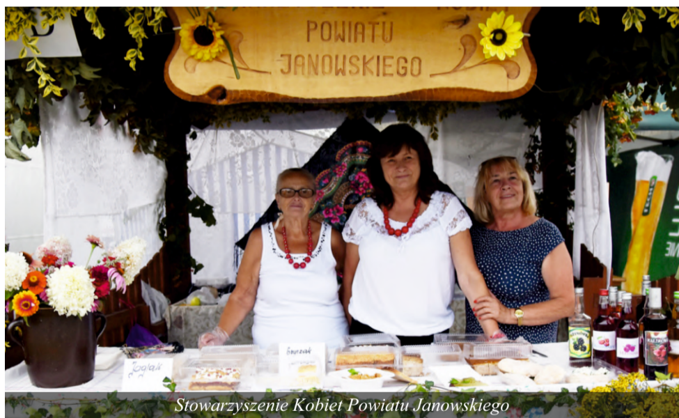
Stowarzyszenie Kobiet Powiatu Janowskiego