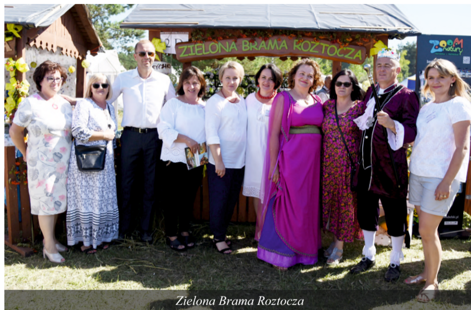
Zielona Brama Roztocza