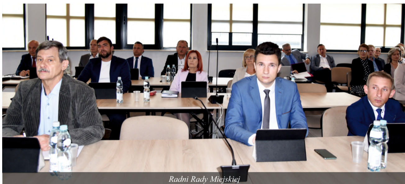
Radni Rady Miejskiej