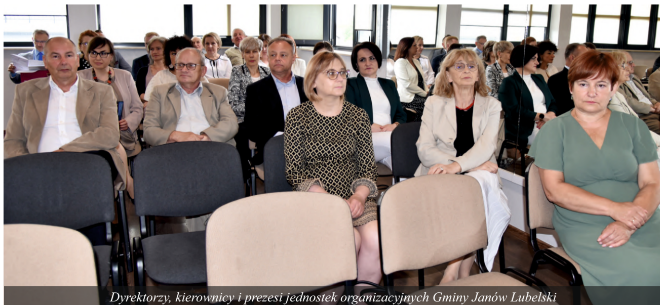
Dyrektorzy, kierownicy i prezesi jednostek organizacyjnych Gminy Janów Lubelski