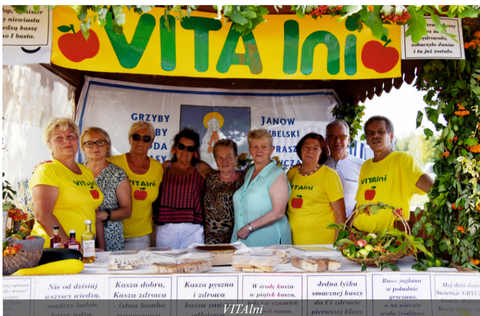
GRZYBY BY DA ASY JANOW BELSKI PRASZ NCZ Nie od dzisiaj jeszemy wiedz. mądry ludzie kasze jedzą. Kasza dobra, Kasza zdrowa - istna bomba magnezowa. Kasza pyszna i zdrowa kasza zau odlatowa. W srode kasza w piątek kasza, leć za czwartek jest nasza. Jedna łyżka smacznej kaszy da Ci zdrowie pierwszej klasy. Rano paglana w południe gruczano, a na wieczór woda zrodzana. Hej dziś Janów Societaje GRZYCZ Gruczano Kaszy