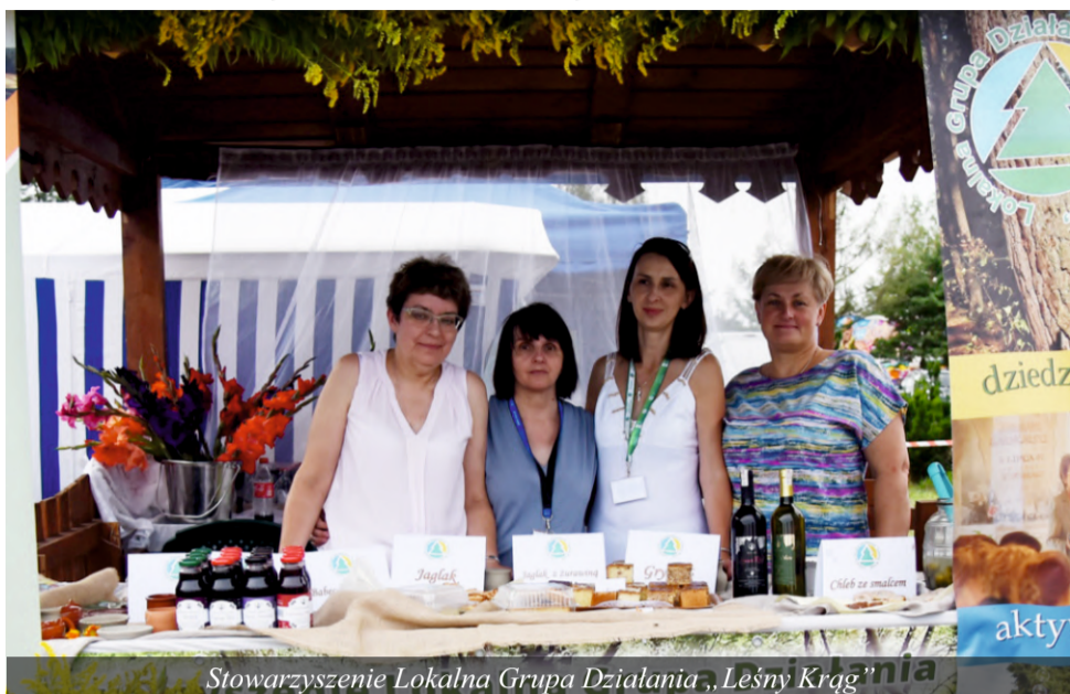
Stowarzyszenie Lokalna Grupa Działania „Leśny Krąg”