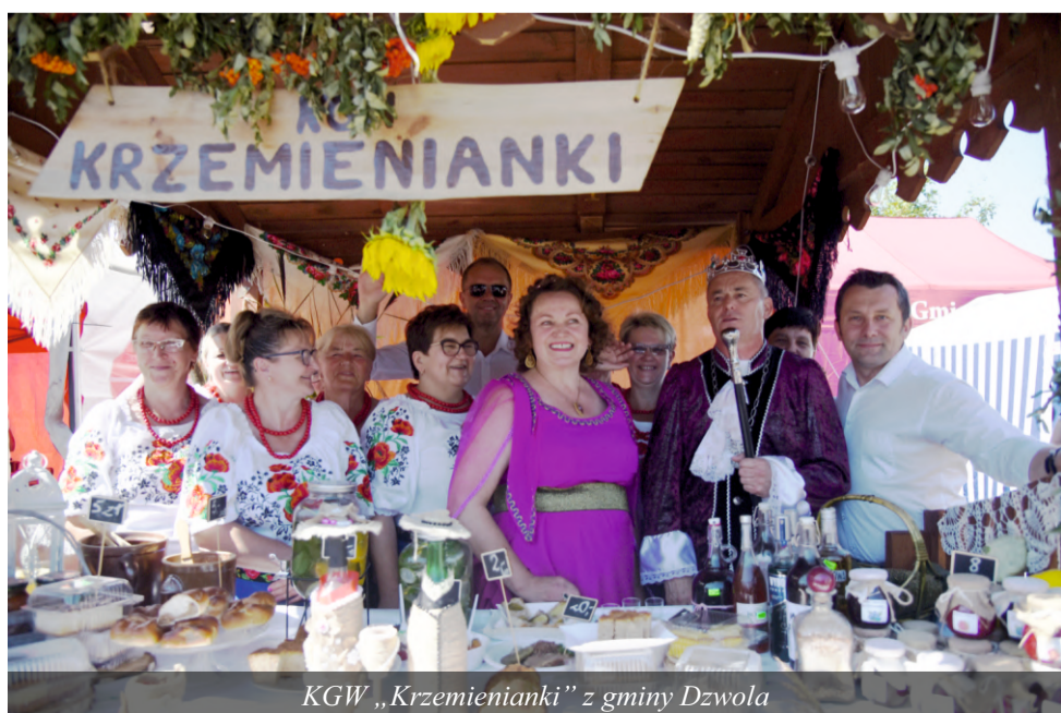
KGW „Krzemianki” z gminy Dzwola