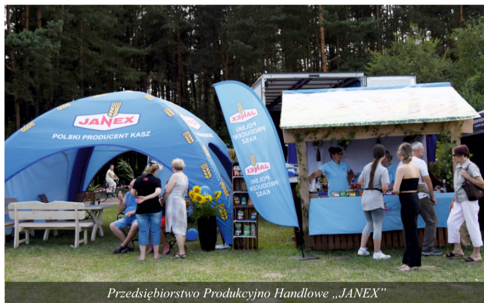
Przedsiębiorstwo Produkcyjno Handlowe „JANEX”