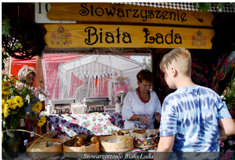
Stowarzyszenie Biała Łada