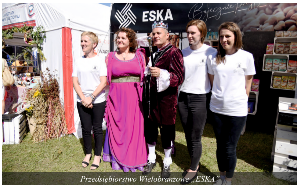
Przedsiębiorstwo Wielobranżowe „ESKA”