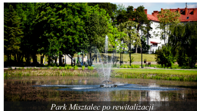
Park Misztalec po rewitalizacji