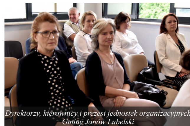
Dyrektorzy, kierownicy i prezesi jednostek organizacyjnych Gminy Janów Lubelski