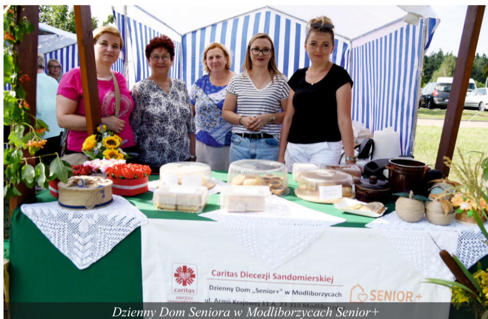
Caritas Diecezji Sandomierskiej Dzienny Dom „Senior+” w Modliborzycach ul. Armii Krajowej 11, 25-310 Modliborzycy SENIOR+