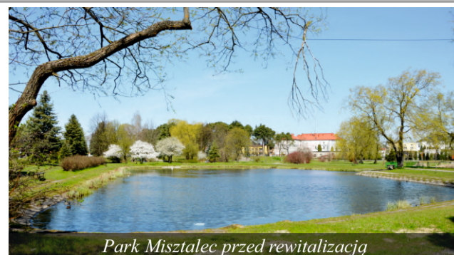
Park Misztalec przed rewitalizacją