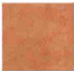
Płytką mrozoodporną 30x30 25,50 Zł