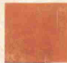
Płytką mrozoodporną 30x30 29,60 Zł

Biłgoraj, ul. Komorowskiego 25, tel. (0 84) 686 73 34