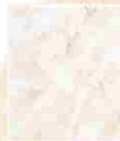
Glazura 20x25 21,90 Zł