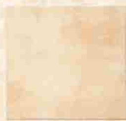
Płytką mrozoodporną 30x30 24,50 Zł