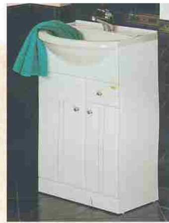
Umywalka i szafka 256,00 Zł