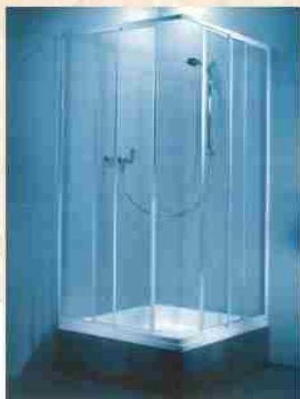
Kabina i brodzik 464,00 Zł