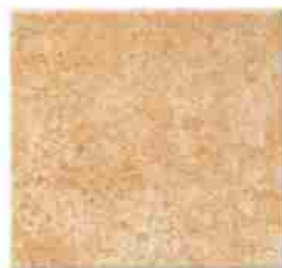
Płytką mrozoodporną 30x30 29,50 Zł