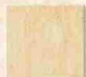
Glazura 20x20 22,00 Zł