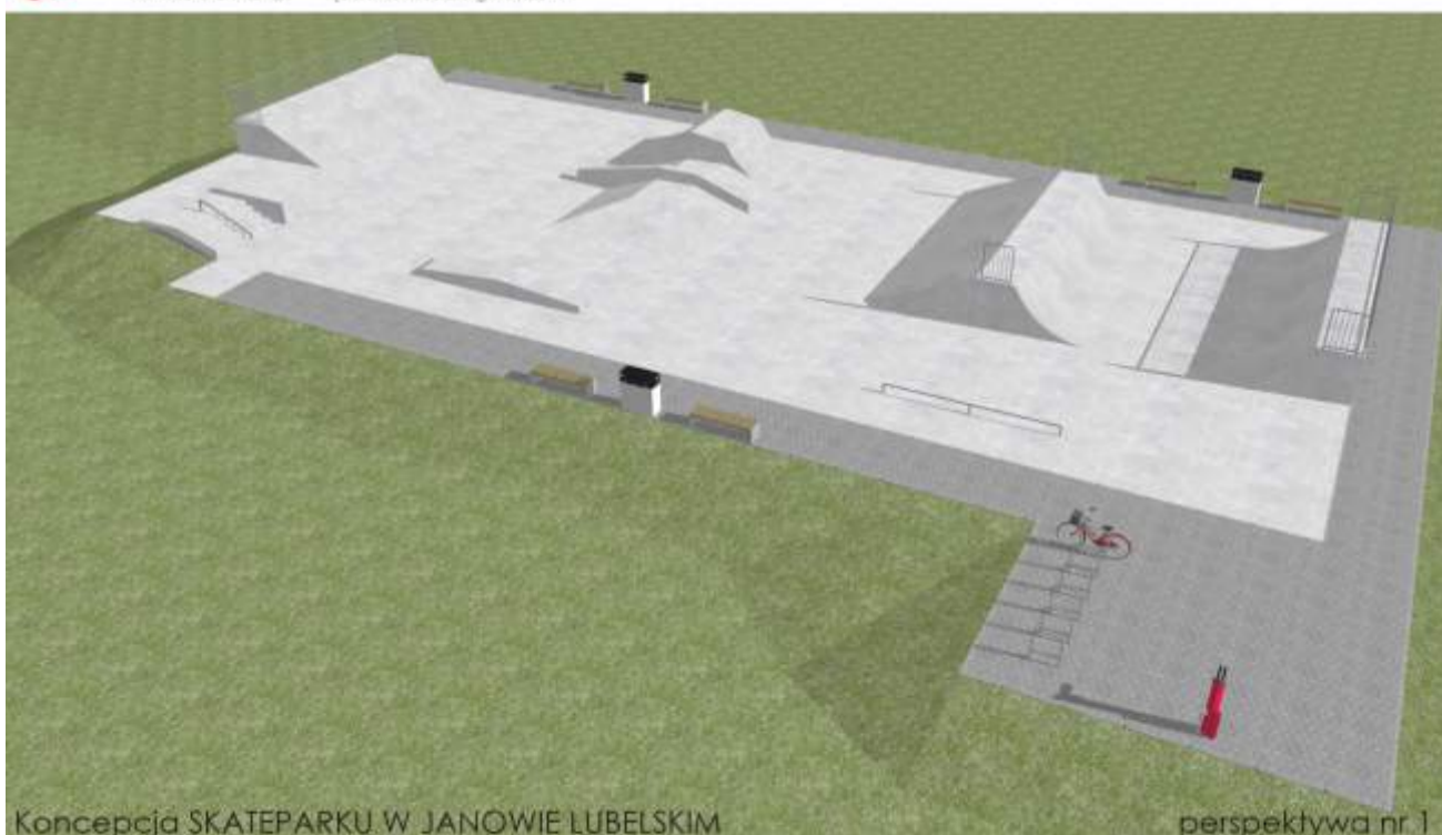
Koncepcja SKATEPARKU W JANOWIE LUBELSKIM

JOANNA OKRASKA ul. Łukowa 16 lok. 4 93-410 Łódź telefon 601 36 10 66 www.e-architekt.pl joanna.okraska@gmail.com