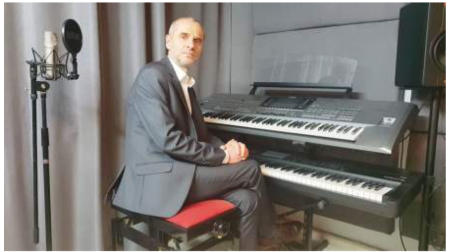
Muzyka aranżacja i wykonanie - Sylwester Bernaciak Produkcja i montaż filmu - Hubert Ryfiński